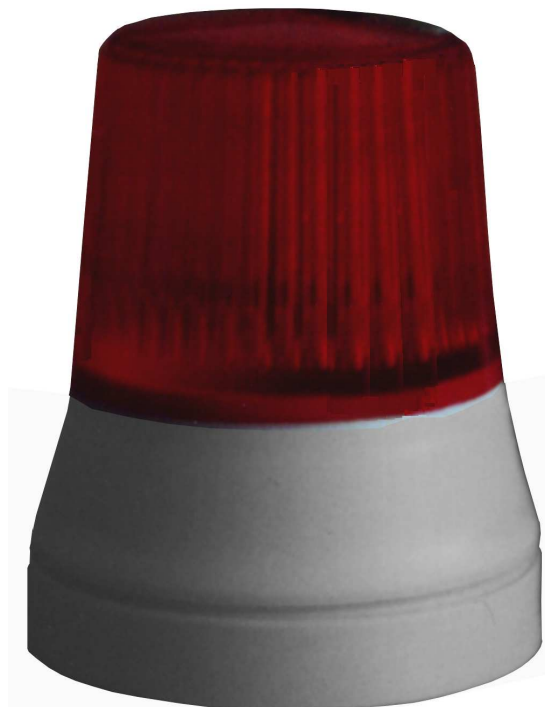
RLFW 13, hier: Signalfarbe rot